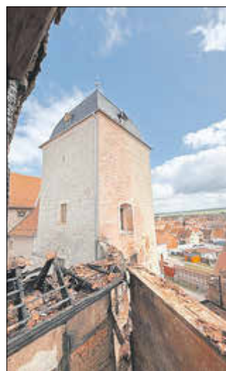
Abbildung: Alte Küche und Palasturm auf der Burg Weißensee nach dem Brand am 25./26. März 2026

Twitter / Instagram: schloesserstiftung. thueringen