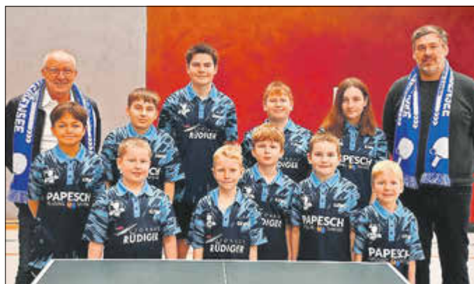
Der Nachwuchs bedankt sich recht herzlich für die neuen Shirts