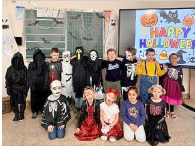
Klasse 1a und 1b

Am Nachmittag im Hort ging dann die Party richtig los. Hier gab es ebenfalls vielfältig Angebote, wie Fühlkisten, Bastelstationen an denen tolle Fledermäuse hergestellt werden konnten, Gruselschminken, Spiel, Tanz und Musik.