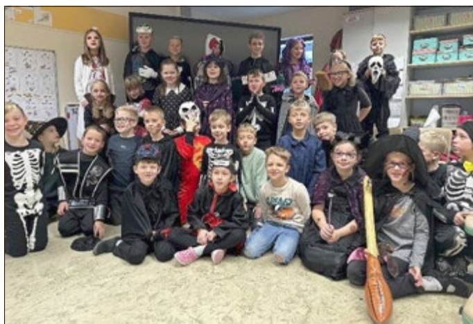
Klasse 2a und 2b