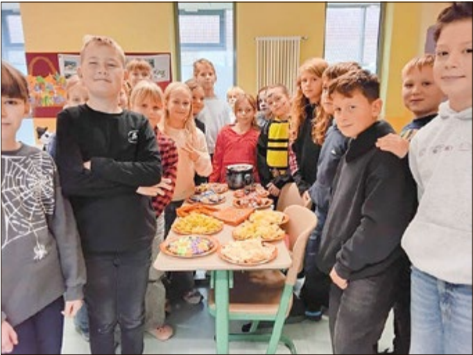
Klasse 4a und 4b