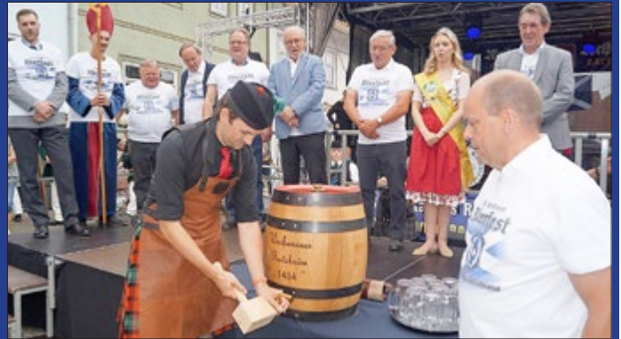
Gäste zum Weißenseer Bierfest 1434