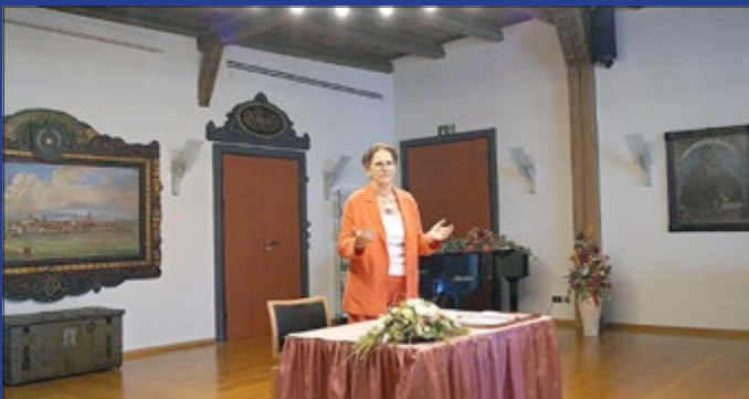
Autorenlesung am 30. Juni im historischen Festsaal