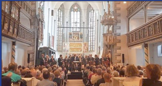
MDR Musiksommer 25. Juni: Das MDR-Sinfonie- orchester zu Gast in der Kulturkirche St. Peter und Paul