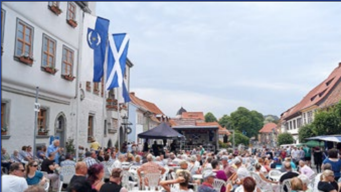
Marktplatz zum Bierfest „Weißensee trifft Schottland“