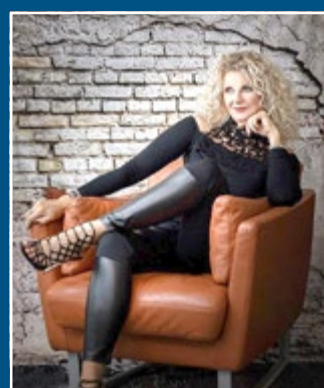
Moderation und Gesang mit Silke Fischer