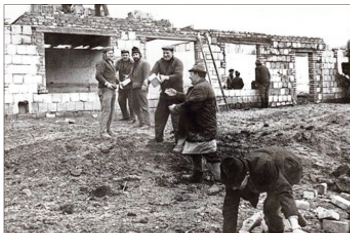
Bau des Anglerheims am Gondelteich in Weißensee (1974)