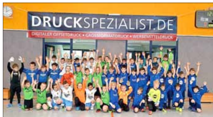
Gruppenbild mit allen Teilnehmern

im Namen der F-Junioren des FC Weißensee 03