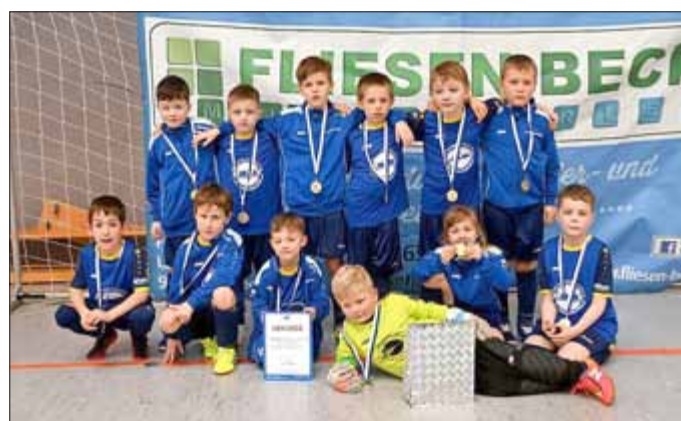
Mannschaft der F-Junioren des FC Weißensee 03