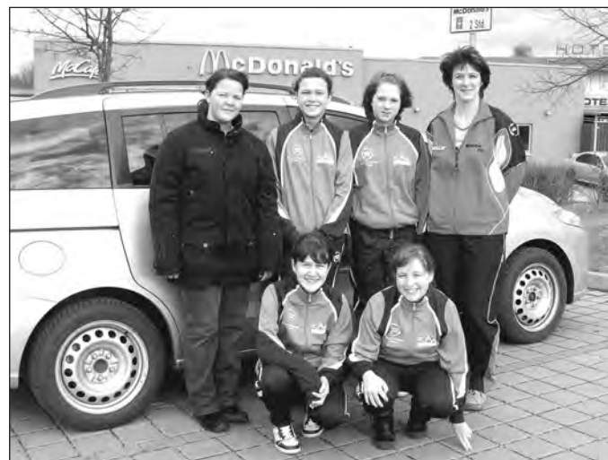
Im Anschluss an die Meisterschaft gönnten wir uns alle einen kleinen „Imbiss“