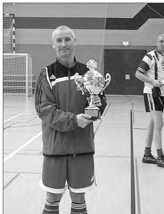
Der Siegerpokal ging in diesem Jahr nach Straußfurt